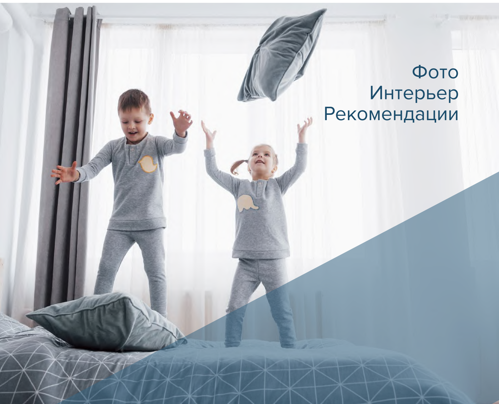
Фото Интерьер Рекомендации